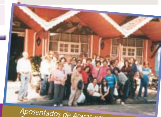
Aposentados de Araras em excursão a Campos de Jordão, em julho de 2008

e-mails: aposentados@apeoesp.org.br e jumara_viana@yahoo.com.br